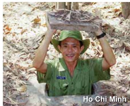
Ho Chi Minh

Café da manhã. Hoje dedicaremos nosso dia a visitar duas das principais atrações de Ho Chi Minh e vizinhanças. A antiga Saigon hoje é chamada Ho Chi Minh em homenagem ao líder que lutou contra o imperialismo francês e as invasões japonesas. Pela manhã será a vez de visitarmos os famosos túneis de “Củ Chi”, construídos a cerca de 70 quilômetros da cidade de Ho Chi