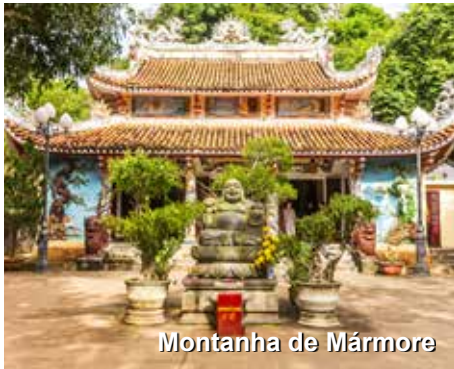
Montanha de Mármore

espetaculares das montanhas às margens do Mar da China, entremeadas por praias, florestas e cidades vistas ao longe. Apenas para nos situarmos, essa estrada foi escolhida há algum tempo como a estrada costeira mais linda do mundo, por um programa da televisão Inglesa. “Hai Van” significa Mar de Nuvens, em língua vietnamita, e descreve perfeitamente essa costa montanhosa e úmida que conecta o mar ao céu. Aqui unem-se o norte mais desenvolvido, mais frio e sério do Vietnam, a seu sul, mais descolado, tropical e relaxado. Durante nossa viagem de hoje pararemos na Montanha de Mármore e Museu Cham. Preparem-se para um dia especial! Almoço e jantar em restaurantes locais. Almoço e Jantar.