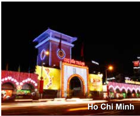
Ho Chi Minh

Palácio Presidencial, o Museu da Guerra e o mercado local de Bến Thành. Seguiremos então para um delicioso jantar em um pitoresco barco em um cruzeiro pelo Rio Saigon. Cozinha contemporânea Indochinesa nos aguardará, para nos inspirar em um jantar que mistura show e buffet. Almoço e Jantar.