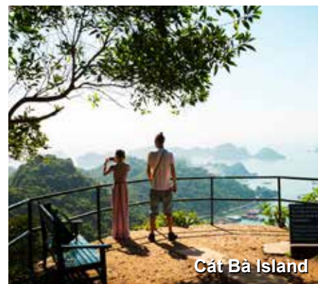
Cát Bà Island

Aqueles que desejarem ver um amanhecer espetacular, serão convidados a acordar bem cedo hoje, a começar o dia com uma aula de Tai Chi no solarium do navio. A seguir, aqueles que desejarem, mudarão de barco para participar de um passeio no Cát Bà World Biosphere, e mais cinco minutos de ônibus, a conhecer a Caverna de Hoa Cuong, a famosa e espetacular caverna das estalagmites.