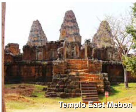
Templo East Mebon

Visitaremos ainda o templo de “East Mebon”, peculiar por ter sido construído em uma ilha artificial no centro de um reservatório de água que não existe mais. “Pre Rup”, templo de montanha arquitetônica e artisticamente superior. “Neak Pen” – pequeno templo localizado no centro do reservatório, que apenas de barco se alcança; Piscinas em formato de flor de lótus o circundam e, se a água estiver rasa o suficiente, veremos esculturas em formato de cabeças de homens e animais em cada piscina.