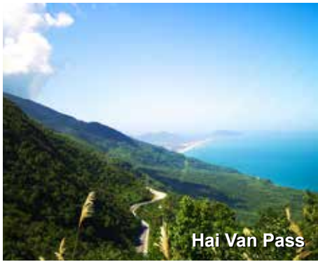
Hai Van Pass

espetaculares das montanhas às margens do Mar da China, entremeadas por praias, florestas e cidades vistas ao longe. Apenas para nos situarmos, essa estrada foi escolhida há algum tempo como a estrada costeira mais linda do mundo, por um programa da televisão Inglesa. “Hai Van” significa Mar de Nuvens, em língua vietnamita, e descreve perfeitamente essa costa montanhosa e úmida que conecta o mar ao céu. Aqui unem-se o norte mais desenvolvido, mais frio e sério do Vietnam, a seu sul, mais descolado, tropical e relaxado. Durante nossa viagem de hoje pararemos na Montanha de Mármore e Museu Cham. Preparem-se para um dia especial! Almoço e jantar em restaurantes locais. Almoço e Jantar.