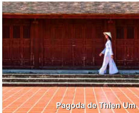
Pagoda de Thien Um

a cerca de 3 quilômetros de Hué, nos bancos do rio Perfume. Este templo budista nos preencherá com sua aura de paz. Trata-se do mais antigo mosteiro de Hué, construído no século XVII. Visitaremos a cidadela real e a cidade imperial, locais que apresentam a glória de outros tempos de Hué. O Imperador Gia Long moldou a cidadela real com base na famosa e encantadora Cidade Proibida de Pequim, na China. Ela é composta de 3 áreas muradas, uma dentro da outra, como que nos apresentando as cidades fortificadas orientais da Idade Média. Três cidades, uma dentro da outra, que distinguia a nobreza de seus moradores, por sua localização. Palácios residenciais, salas de audiência civis ou atividades religiosas. Tudo dentro de suas muralhas, e tudo Patrimônio Mundial da Humanidade declarado pela UNESCO.