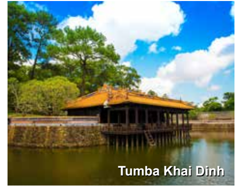
Tumba Khai Dinh

pescava o imperador, ocupava-se com música e escrevia poesias. Eis um local muito mais afeito ao prazer e relaxamento, que de uma tumba propriamente dita, uma espécie de segunda residência do Imperador. Antes de finalizarmos nosso dia, conheceremos o colorido mercado de Dong Ba. Jantaremos em um restaurante local e seguiremos para nosso hotel. Almoço e Jantar.