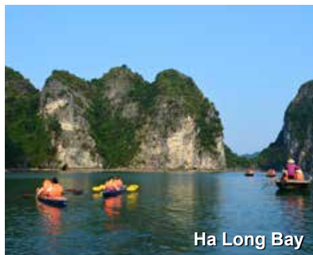
Ha Long Bay

que desejarem poderão deixar o barco para passear de kayak (se as condições climáticas permitirem), ou de barco de bambu a remo, dirigidos por vietnamitas simpáticos e acolhedores que aguardam ansiosamente por nossa chegada. Aqueles que fizerem esse passeio conhecerão as cavernas de águas claras e escuras da região.