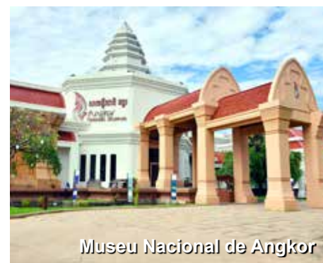
Museu Nacional de Angkor

informações e formação sobre a arte e cultura Khmer, através de coleções datadas desde os séculos IX ao XIV. Almoçaremos em um restaurante local e retornaremos a nosso hotel a aproveitá-lo um pouco mais hoje. À noite seguiremos para um jantar combinado a um show de dança no Teatro Angkor para comemorarmos o encerramento com chave de ouro de nossa viagem. Retornaremos então a nosso hotel. Almoço e Jantar.