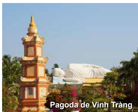
Pagoda de Vinh Tràng