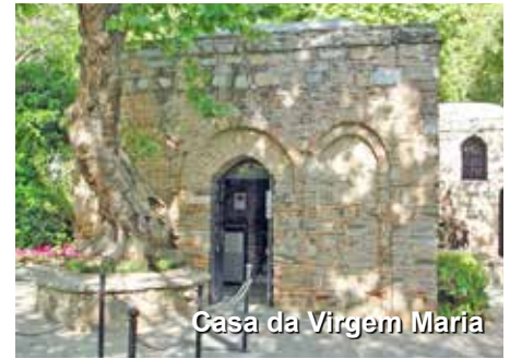
Casa da Virgem Maria

Café da manhã. Hoje visitaremos Kusadasi e Éfeso, mais especificamente a Casa da Virgem Maria (visitada pelo Papa Bento XVI, e onde ele rezou recentemente a Santa Missa); e também visitaremos as ruínas romanas, uma das 3 mais bem conservadas do mundo. Jantar.