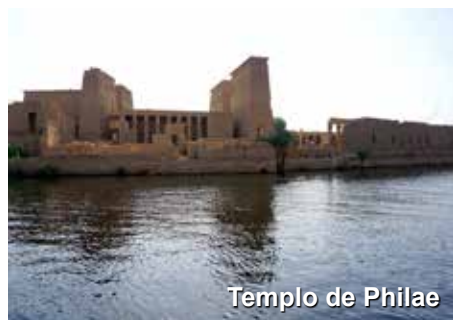
Templo de Philae

Traslado ao aeroporto doméstico para voo com destino à Aswan. Chegada e traslado ao porto para embarque em cruzeiro de 3 noites pelo rio Nilo. Visita ao templo de Philae, dedicado à deusa Ísis (deusa da fertilidade e da maternidade) e também muito frequentado por Cleópatra.