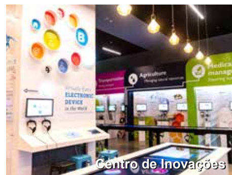
Centro de Inovações

A seguir, no começo da tarde, seguiremos com uma visita ao Centro de Inovações de Israel. Se estamos falando de inovações e conquistas desse povo, este museu é uma parada obrigatória para todos nós! Se o tempo nos permitir, visitaremos ainda, hoje, o Hall da Independência de Israel, outro marco importante da história deste povo, e desta Nação, bem como o Centro Yitzhak Rabin. Almoço e jantar.