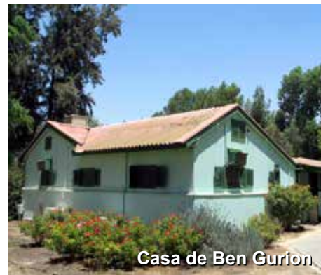
Casa de Ben Gurion

Café da manhã. Partiremos de nosso hotel hoje para conhecer, logo pela manhã, a casa de Ben Gurion. Para quem é amante de história, esse 1º Primeiro Ministro e 1º Ministro da Defesa de Israel, guarda muito a contar. Seguiremos para a região do Porto de Tel Aviv, para um passeio a pé à beira mar, e então um almoço bem gostoso naquela região.