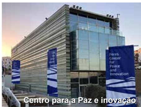
Centro para a Paz e inovação

pé por essa cidade, de Joje, aonde aportaram em Israel os Cedros do Líbano que foram utilizados para a construção do grande Templo de Salomão. É uma área que se ilumina maravilhosamente pela noite, e que valerá nosso tempo e passeio! Almoço e jantar.