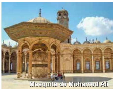
Mesquita de Mohamed Ali

Café da manhã. Após termos realizado o maravilhoso cruzeiro de 3 noites pelo rio Nilo, retornaremos ao Cairo. Sairemos para um city tour da cidade do Cairo, visitando a cidade Antiga, igreja de São Sérgio construída sobre uma cripta onde acredita-se que permaneceu a Sagrada Família durante sua fuga ao Egito, sinagoga de Bem Ezra, cidadela de Saladino (local que oferece a melhor vista panorâmica da cidade), mesquita de Mohamed Ali (ou mesquita de Alabastro).