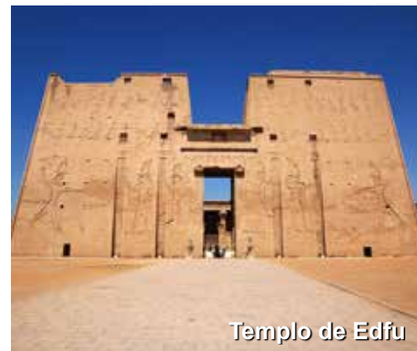
Templo de Edfu

Pela manhã visitaremos o templo de Hórus em Edfu. À tarde visitaremos o templo de Esna e então seguiremos navegação até Luxor. Pensão completa a bordo, não incluindo bebidas.