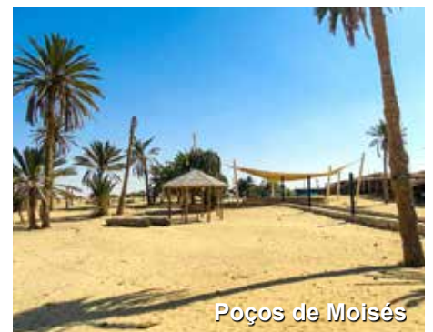
Poços de Moisés

Café da manhã. E hoje deixaremos a região desse mar que exploramos pelos últimos dias, a seguir rumo à capital do Egito, a cidade do Cairo que nos encanta por toda a história que encerra. Atravessaremos o Canal de Suez e teremos a oportunidade de um verdadeiro Oasis no Deserto, local dos “Poços de Moisés”. Almoço e jantar.