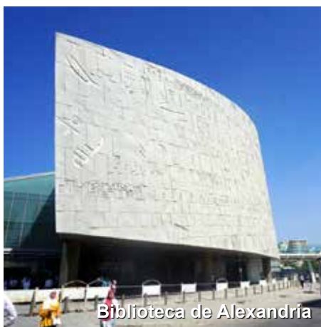
Biblioteca de Alexandria