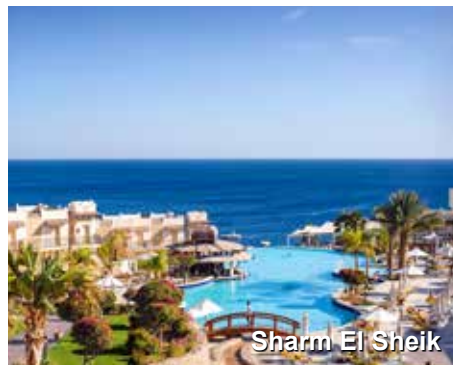
Sharm El Sheikh

a Jordânia, e cruzar a fronteira para chegar ao Egito. Ali seguiremos para nada menos que o recanto egípcio de mergulho, talvez um dos lugares mais lindos do mundo para essa prática. Sharm El Sheikh. Almoço e jantar.