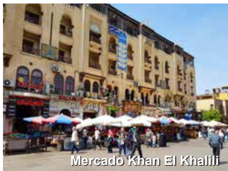
Mercado Khan El Khalili

Visitaremos, também, o museu do Cairo (com entrada) e mercado de Khan El Khalili. Almoço e jantar.