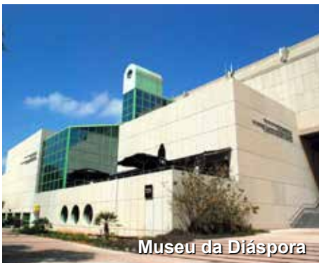
Museu da Diáspora

Visitaremos o Museu da Diáspora, também chamado Museu do Povo Judeu. Imagine só um museu que reúna a forma de manutenção da identidade, mundo afora, do povo judeu, com todos os feitos que esse povo conquistou, como se integrou às comunidades com que viveu e como se desenvolveu fora de Israel, para afinal retornar mais tarde.