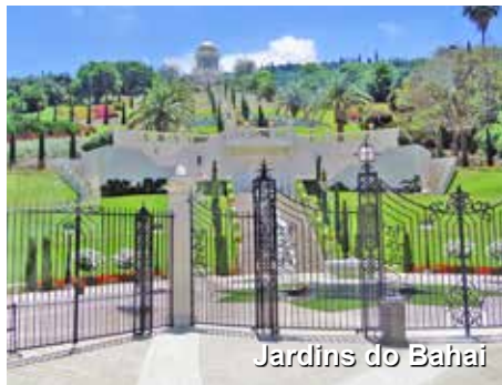
Jardins do Bahai

A seguir, viajaremos para a cidade de Haifa, cidade no norte de Israel, para conhecer os famosos Jardins do Bahai, e o Technion, centro universitário e tecnológico de onde egressaram as maiores cabeças de Israel, dentre elas físicos, químicos, engenheiros e muitos prêmios Nobel que marcaram a humanidade com seus feitos no campo da ciência. Ao final do dia