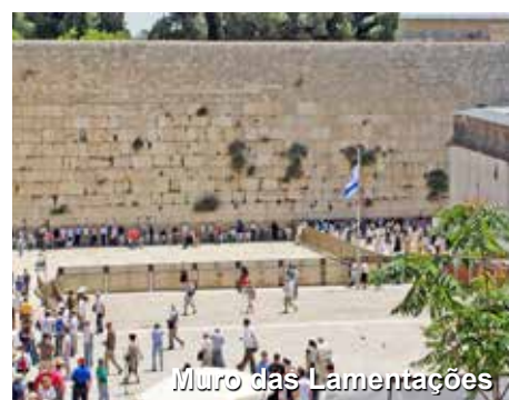
Muro das Lamentações

Hoje conheceremos ainda o famoso Muro das Lamentações, já que dentro das Muralhas estaremos!