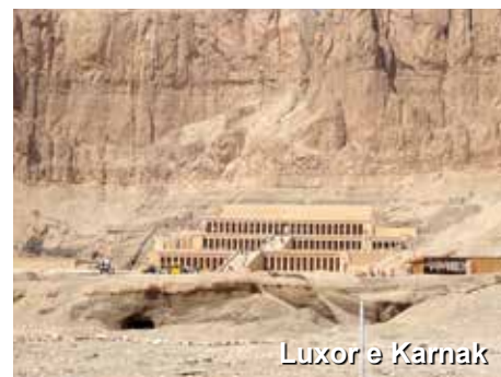
Luxor e Karnak

Visitaremos os templos de Luxor e Karnak, ambos dedicados ao deus Amom (deus do império egípcio) e às divindades Mut (esposa de Amom) e Khonsu (deus da lua). Pensão completa a bordo, não incluindo bebidas.