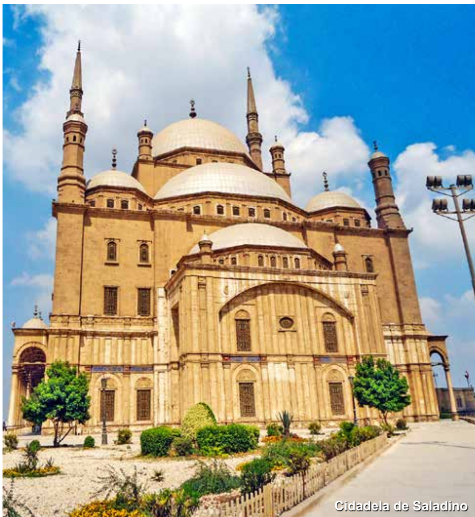
Cidadela de Saladino

Café da manhã. Hoje visitaremos a histórica biblioteca de Alexandria, um dos “centros do saber” da antiguidade e destruída entre os séculos I a.C e IV d.C.. No fim da tarde retornaremos ao Cairo. Almoço e jantar.