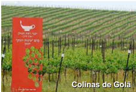
Colinas de Golã

De lá, seguiremos viagem até uma vinícola localizada nas Colinas de Golã, para entendermos melhor a história do vinho em Israel, e sua qualidade nos dias de hoje.